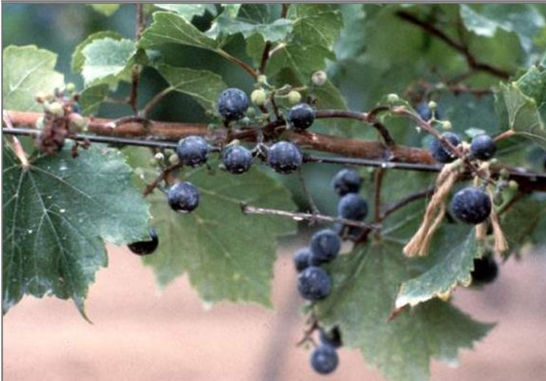
Straggly and shell-berried clusters in a PRMV-infected vine