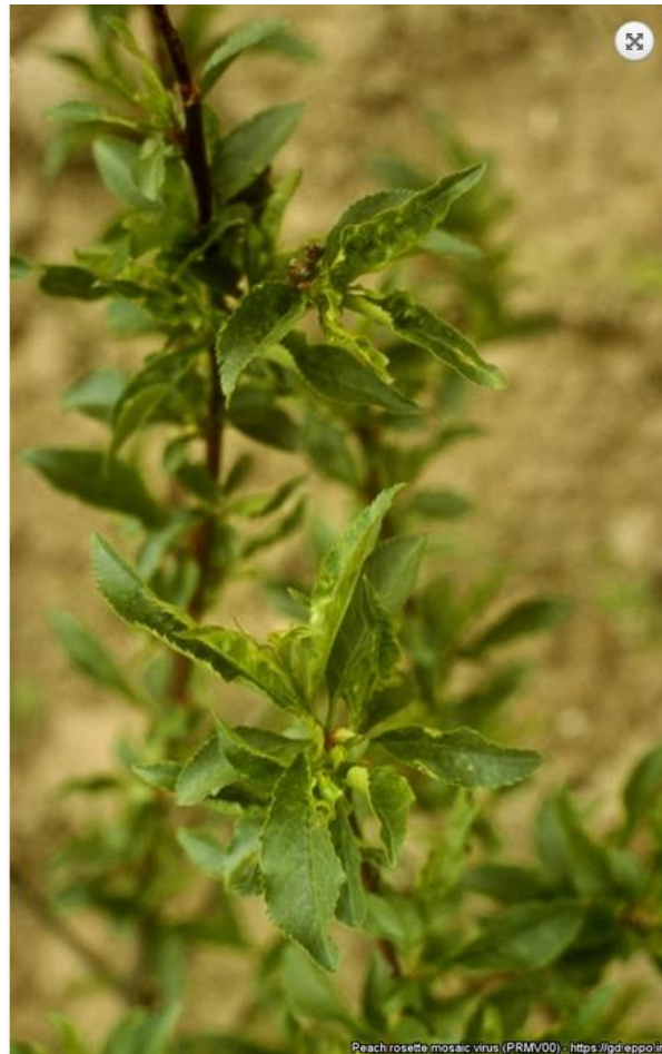
Symptoms of Peach rosette mosaic virus on peach.